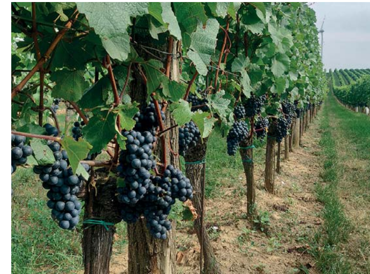
... und Weinbau.