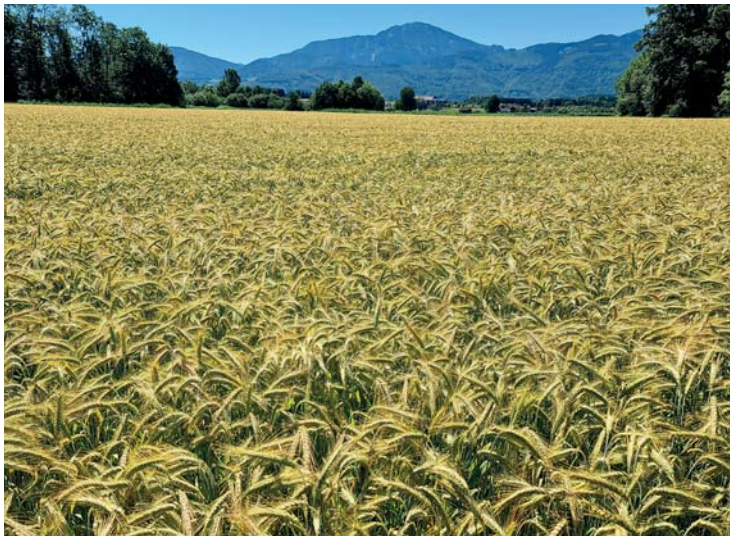
Das KE-Konzept ist optimal für Feldbau ...