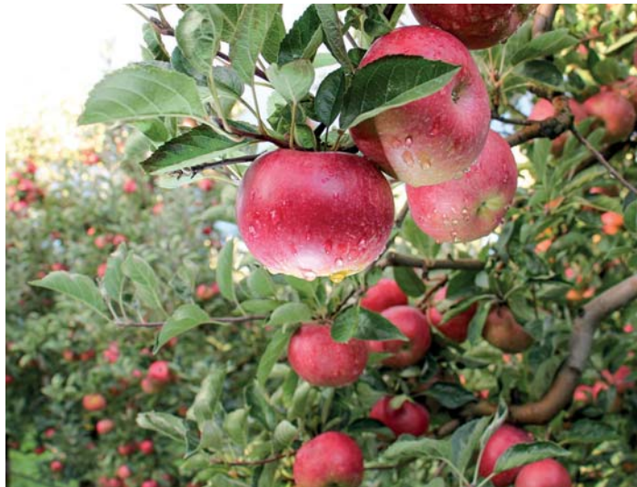
... Obstbau ...