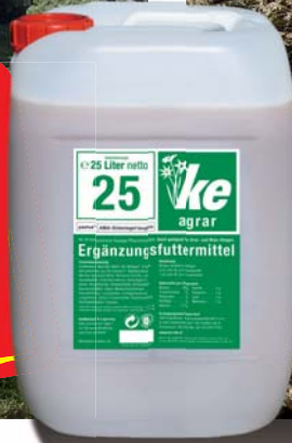
Stabilere Silagen mit KE-agrar

Ein Kanister reicht für 100 Tonnen Grassilage!